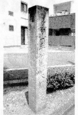
半僧坊道の里程石

半僧坊道（奥山道）は、奥山半僧坊に向かう道のことです。三方原追分の交差点の中には、参詣客のために里程石で案内をしてくれています。また東三方神社の赤松の鳥居は、奥山半僧坊の方角を向いて立っています。なぜ神社の鳥居がお寺（方広寺）に向いて立っているのか…など、当日は浜松の奥山道・秋葉道をお話します。